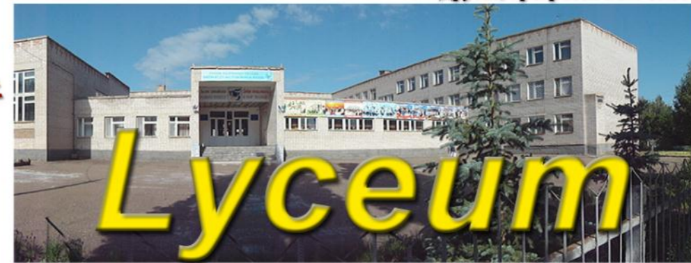
Печатный орган муниципального общеобразовательного учреждения Лицей №6 муниципального района Мелеузовский район Республики Башкортостан